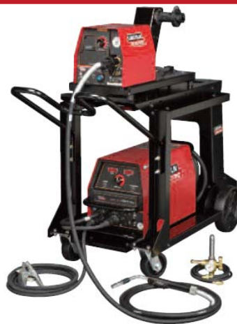
Se muestra: Invertec® V350 PRO Modelo Factory/LF-72 Trabajo Pesado Ready-Pack®